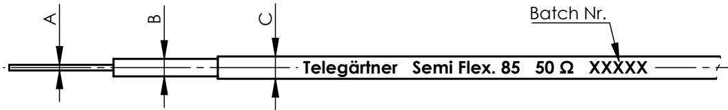
marking / Kennzeichnung

Packaging unit: 25 m ± 0,5 m, as cable ring, tied. (f) Verpackungseinheit: 25 m ± 0,5 m, als Ring gebunden.