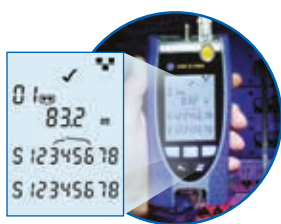
Verdrahtungstest inkl. Länge