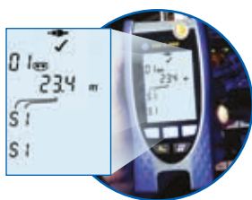
Überprüfung einer Koaxleitung